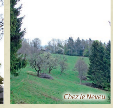
Chez le Neveu