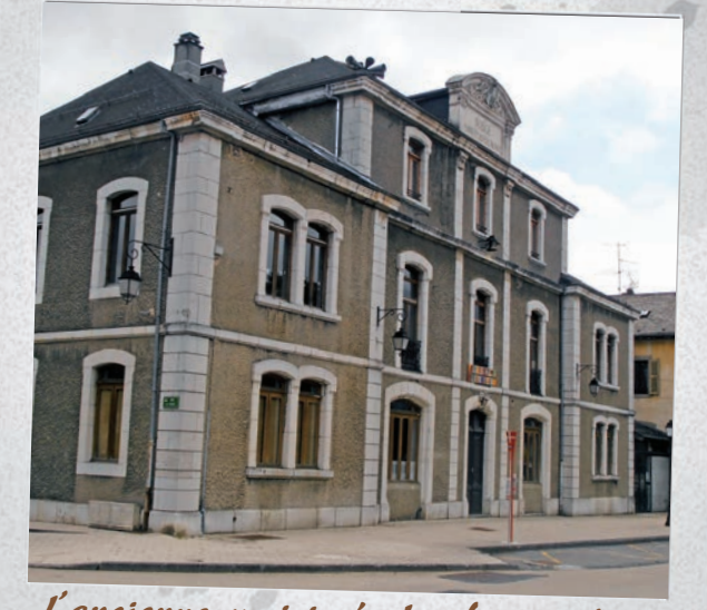
L'ancienne mairie-école, futur siège de la Communauté de Communes