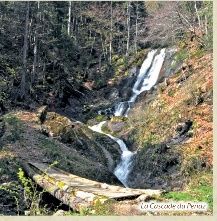
La Cascade du Penaz

En dessous de Lilette, l'itinéraire serpente à travers forêts et pâtures en suivant le « Chemin des Graz » dont l'empiérement est probablement d'époque romaine et en longeant toute une succession de cascades. L'accès au bassin qui recueille ces eaux est aménagé et vous apprécierez le spectacle de cette dernière chute d'eau.