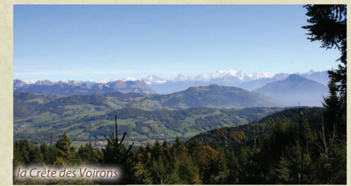
La Crête des Voiron

Du parking du Penaz, monter le chemin qui traverse les prés avant de s'enfoncer dans la forêt. Au bout de cinq minutes, prendre le temps d'aller regarder une petite cascade située dans le ruisseau qui coule à votre gauche. La visite terminée, revenir sur ses pas pour reprendre le chemin. Pendant une vingtaine de minutes, grimper dans la forêt avant d'arriver à des maisons dispersées dans des pâturages. Vous êtes à « Lilette ». De là, le chemin grimpe en direction de « Chez Ruffieux ». Au sortir de la forêt, vous arrivez au monastère des Voiron. Après une visite de la chapelle, vous continuez en direction du signal des Voiron. Si votre horaire vous le permet, suivre la crête sur votre gauche pendant une dizaine de minutes pour arriver en surplomb d'une falaise appelée « Le saut de la pucelle ». Le retour s'effectue par le chemin de montée.