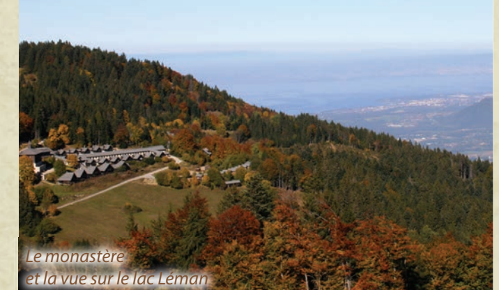
Le Monastère et la vue sur le lac Léman