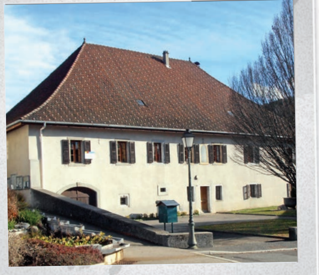
Presbytère - Maison des Associations