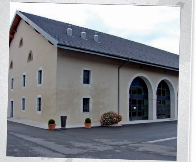
La Salle Communale