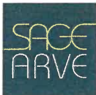
Schéma d'Aménagement de Gestion des Eaux du bassin de l'Arve